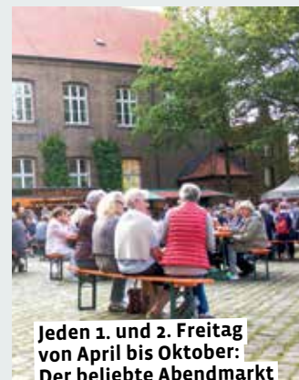
Jeden 1. und 2. Freitag von April bis Oktober: Der beliebte Abendmarkt im Burginnenhof

8.00 bis 12.30 – Wochenmarkt. 16.00 bis 20.00 – Abendmarkt. Innenhof Burg Lüdinghausen. Veranstalter: Lüdinghausen Marketing 19.00 bis 20.30 – Kopfkino. Das neueste Hörspiel „Die drei ???“ hören mit Popcorn & Co. für alle jungen & älteren Fans. Anmeldung erforderlich, Felizitas-Bücherei. www.buecherei-lh.de 19.00 bis 22.00 – Whiskyclub: Duell der Destillen. Der Abend startet mit einer kurzen sensori-