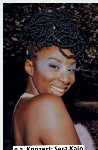
9.3. Konzert: Sera Kalo

18.30 – Künstlerstammtisch. Lüdinghauser Künstler treffen sich einem zwanglosen Austausch. Altes Backhaus