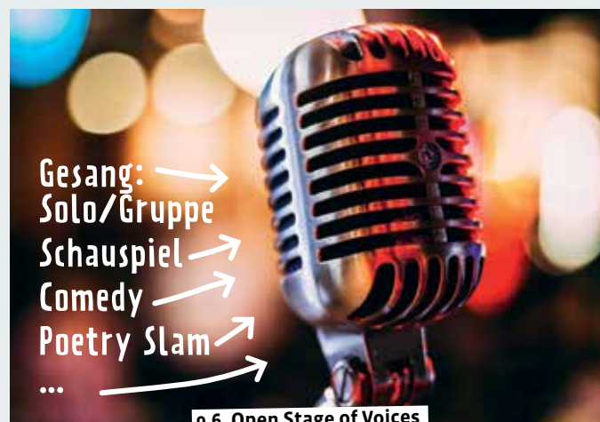
9.6. Open Stage of Voices