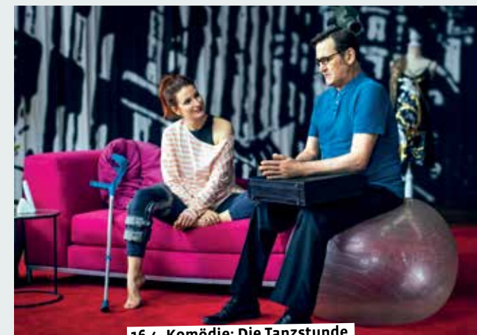
16.4. Komödie: Die Tanzstunde

Ursprünglich, lecker und gesellig erleben die Teilnehmer das Kochen am Lagerfeuer. In diesem etwas anderen Kochkurs werden unterschiedliche Methoden und Hilfsmittel der Feuerküche gezeigt. Biologisches Zentrum, gebührenfrei