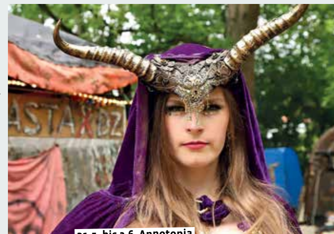
31.5. bis 2.6. Annotopia

9.00 bis 15.00 – Bauernmarkt. Alles dreht sich um die Erdbeere: Buntes Programm und viele