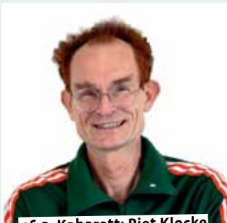
16.3. Kabarett: Piet Klocke

lichen Betrieb besuchen, dann in der Küche der Burg Vischering gemeinsam mit den Produkten kochen. Der Kurs findet in Kooperation mit Lüdinghausen Marketing e. V., der Familienbildungsstätte und der Burg Vischering statt. Anmeldung über die Familienbildungs-